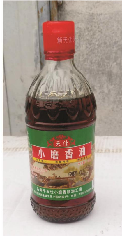
天仕小磨香油产品图片